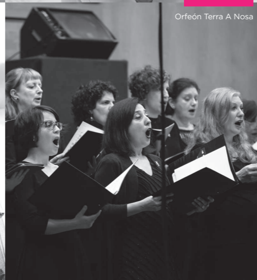
Orfeón Terra A Nosa